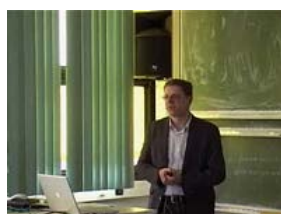
Prof. Dr. Richard Göttlich / Prof. Dr. Siegfried Schindler » FB Chemie der JLU Gießen / Frank Waldschmidt-Diet » Koordinationsstelle Multimedia (KOMM) des HRZ der JLU Gießen